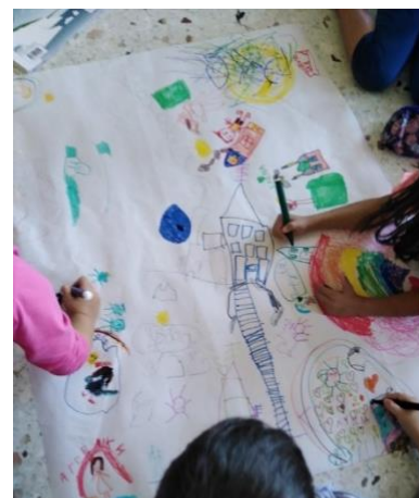
Alunos de uma escola primária grega - que ainda não aprenderam a ler e escrever - expressam-se desenhando uma história "com números e imagens".

Consulte a secção de notícias do nosso website para conhecer as histórias de sucesso e aprendizagens adquiridas durante as atividades-piloto realizadas nos países envolvidos.