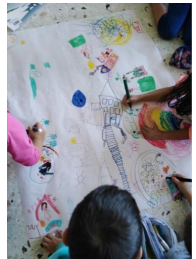
Graikijos pradinės mokyklos pirmos klasės mokiniai, kurie dar nemoka skaityti ir rašyti, išreiškia save piešdami pasakojimus "su skaičiais ir vaizdais", šokdami ir klausydamiesi įvairių šalių pasakų.

Apsilankykite projekto svetainės naujienu skyriuje ir sužinokite daugiau apie sėkmės istorijas ir patirtį, įgytą vykdamą bandomąją veiklą partnerių šalyse.