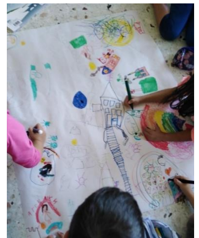
Gli alunni di prima elementare di una scuola elementare in Grecia – che non hanno ancora imparato a leggere e scrivere – si esprimono disegnando una storia "con numeri e immagini", ballando e ascoltando fiabe di diversi paesi

Visita la Sezione News' del nostro sito web per saperne di più sulle nostre storie e sulle lezioni apprese durante le attività pilota nei paesi partner.